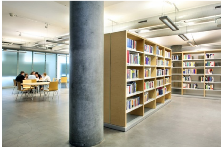
Standort Wirtschaft